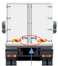
ヒンジ・丁番塗装剥がれ